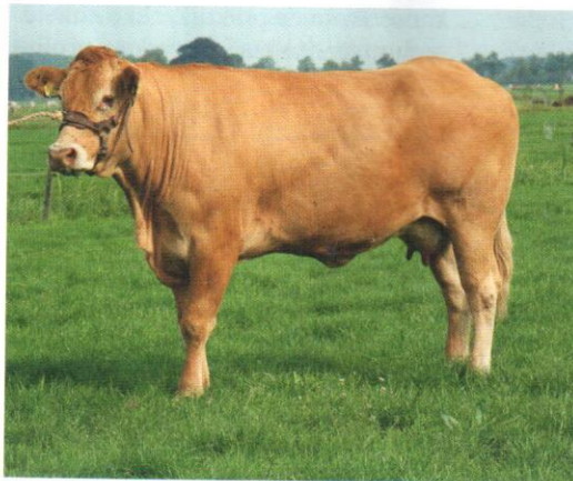
Hyacinth is met 88 punten een prima fokkoe. Zij heeft vier nakomelingen van vier verschillende vaders. Ze behoren tot de top van hun jaargang.